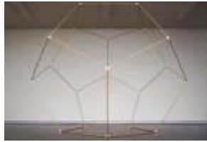
Figure 2 – Photographie d'un dodécaèdre régulier avec le matériel baguettes et connecteurs

Pour cela, le matériel proposé aux élèves est composé de baguettes (représentants les arêtes) et de connecteurs (représentants les sommets). Avec un tel matériel, la construction est totale, la réflexion permanente car les élèves doivent concevoir les faces puis le solide.