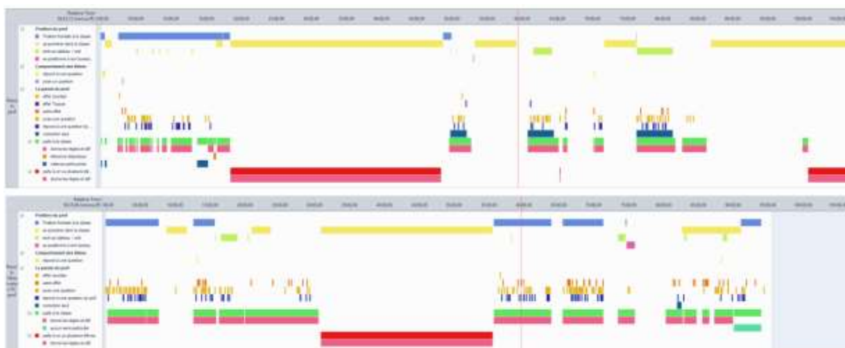
Figure 3 : Visualisation de la séance

Liste des membres du groupe EISTM 2017/18 du collège Zakia Madi de Dembeni :