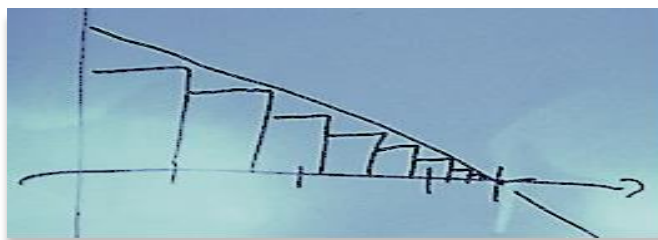
Figure 2. Dessin réalisé au tableau par l'élève 1

Professeur : Oui, c'est vrai qu'il faut... (S'adressant à l'élève E1 toujours au tableau) Tu pourrais nous faire un petit schéma avec les droites, qu'on ait une image sous les yeux. Alors dessine nous la droite d , c'est pas évident sur le dessin.